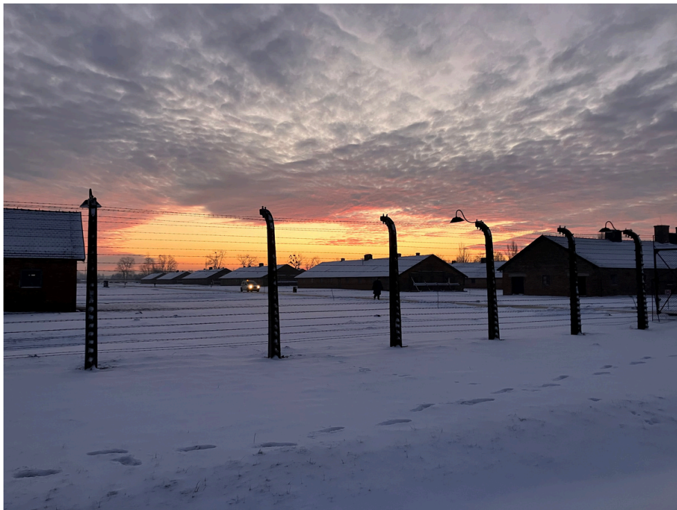
📷 Tomáš Kraus